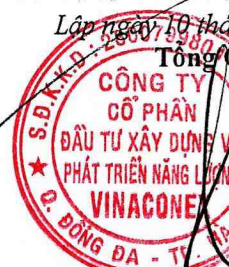
PHẠM BẢO LONG