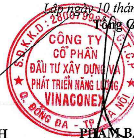
PHẠM BẢO LONG