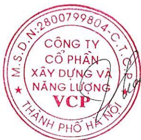
Đinh Thị Hạnh

Biên bản cuộc họp được lập vào lúc 1h00 cùng ngày, ngay sau khi cuộc họp kết thúc và được tất cả các thành viên ban kiểm soát thống nhất thông qua.